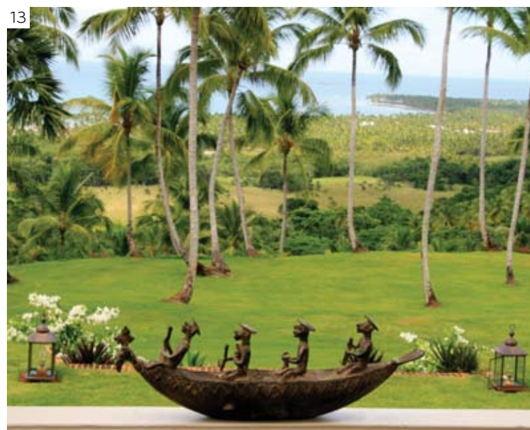
10. Vista frontal de la casa. 11. Detalles de la habitación 2. 12. Sala de estar, segunda planta. 13. Vista desde la terraza.

cante. No obstante, le menciono algunas opciones para un completo disfrute durante su estadía en este perfecto espacio de relajación.